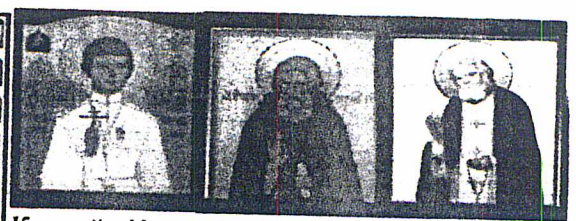
Конвой «Надымской Царственной казачьей Чудотворной иконы», Его Императорского Величества Николая Александровича